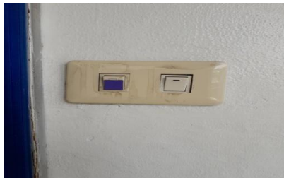
สวิตช์หลอดไฟฟ้า