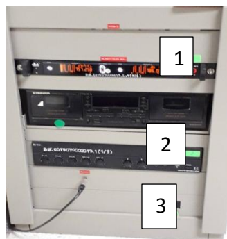
กดเปิดระบบเสียงตามหมายเลข