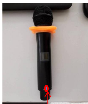
ปุ่มเปิด-ปิด