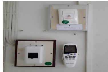
สวิตช์เครื่องฉาย 3 มิติ