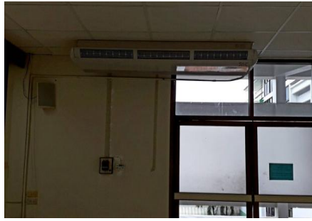
เปิด-ปิดเครื่องปรับอากาศ โดยกดปุ่ม ON/OFF